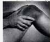
Πόνος στο γόνατο. Πως είναι η αιτία;

Η άμεση απόσυρση της διάταξης είναι επιβεβλημένη. Οι βιταμίνες τα σκευάσματα και τα συμπληρώματα διατροφής σχετίζονται άμεσα με την υγεία των Πολιτών και δεν νοείται η διάθεσή τους μόνο με εμπορικούς όρους».